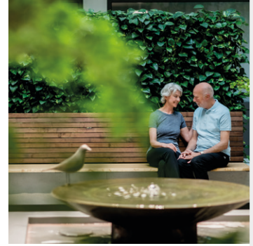
Viele Details sorgen für das Gefühl, der Natur nahe zu sein.